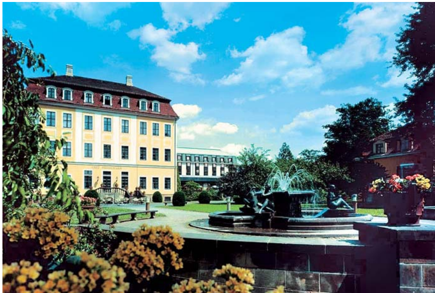
Hotelmarkt Osten stark im Kommen: Drei Dresdner Häuser legten im zweistelligen Prozentbereich zu. Das Westin Bellevue Dresden punktete mit 15 Prozent Umsatzwachstum

Aufgrund umfangreicher Renovierungs- und Modernisierungsmaßnahmen in 2004 glänzt das Park Inn Berlin-Alexanderplatz, Franchisenehmer der Rezdor SAS Hospitality, mit einem Umsatz-